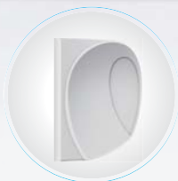
Оригинальные боковые поверхности