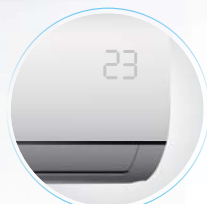
Светящийся встроенный дисплей