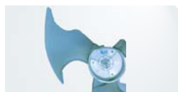
Продуманный бионический дизайн лопастей вентилятора. Форма «подсмотрена» в природе, поэтому очень эффективна.