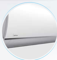
Незаметное воздуховыпускное отверстие