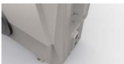
Оригинальная «граненая» форма.