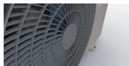
Особая форма воздуховыпускной решетки.